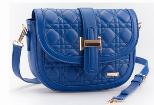
Código: GZO-198 Color: Azul