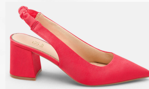
Código: STP-093 Color: Rojo