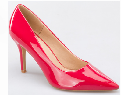
Código: STP-095 Color: Rojo