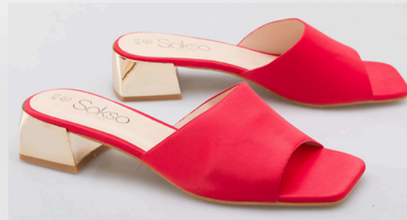
Código: ARL-009 Color: Rojo