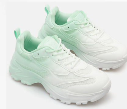
Código: ADO-230 Color: Blanco/Verde