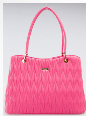
Código: STK-304 Color: Fucsia