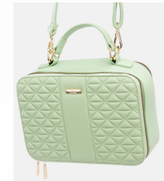
Código: STK-301 Color: Verde