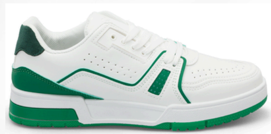
Código: ADO-233 Color: Blanco/Verde