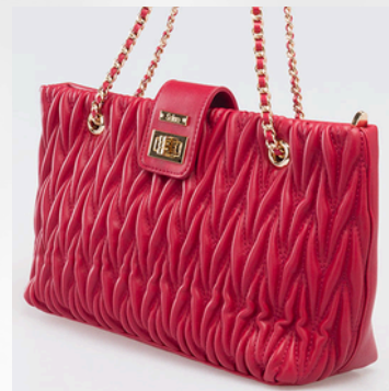
Código: STK-305 Color: Rojo