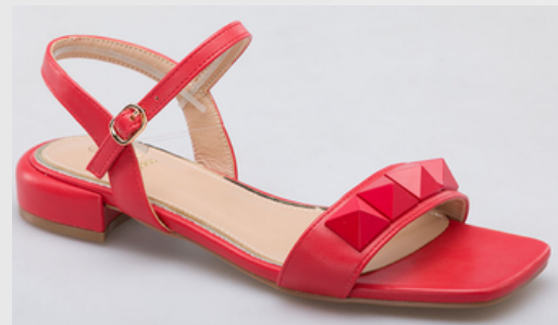
Código: STP-098 Color: Rojo