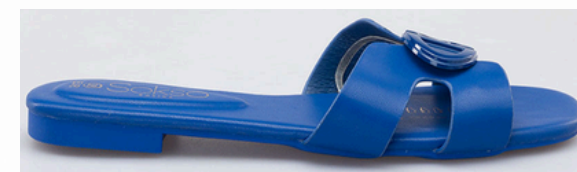
Código: ARL-003 Color: Azulino