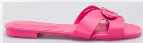
Código: ARL-003 Color: Fucsia