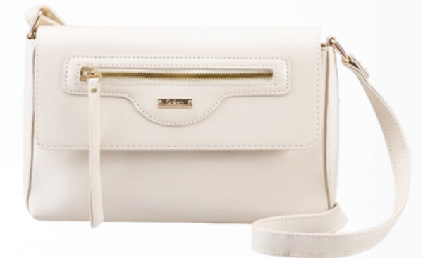
Código: GZO-081A Color: Hueso