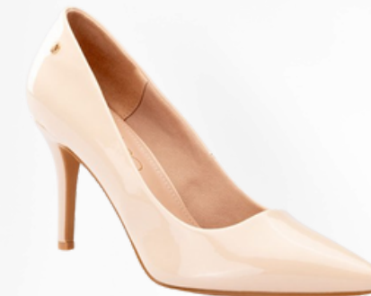
Código: STP-087 Color: Beige