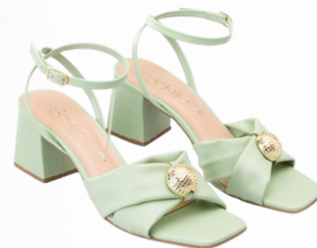
Código: CAM-139 Color: Verde