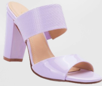
Código: VRS-005 Color: Lila