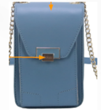
Código: GZO-087A Color: Acero