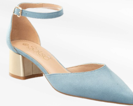
Código: STP-089 Color: Celeste