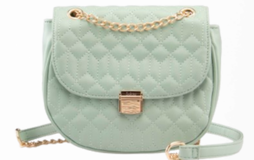
Código: GZO-224 Color: Verde