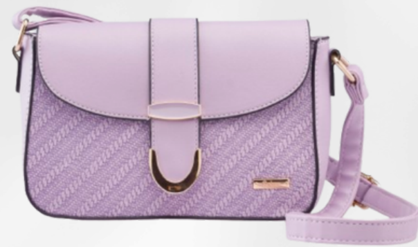
Código: GZO-225 Color: Lila