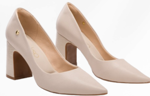
Código: BCE-186 Color: Hueso