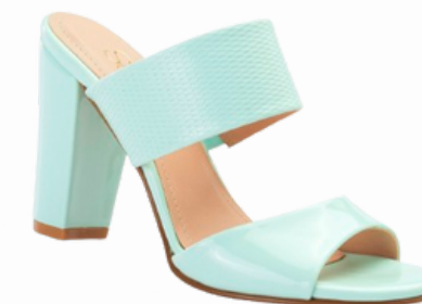
Código: VRS-005 Color: Verde menta