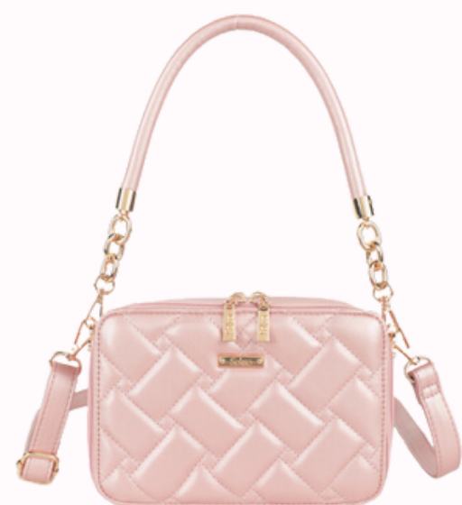
STK-329 palo rosa