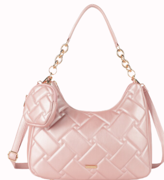
STK-328 palo rosa