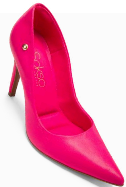
Modelo: BCE-188 Color: FUCSIA Página: 49