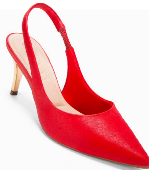
Modelo: BCE-187 Color: ROJO Página: 45