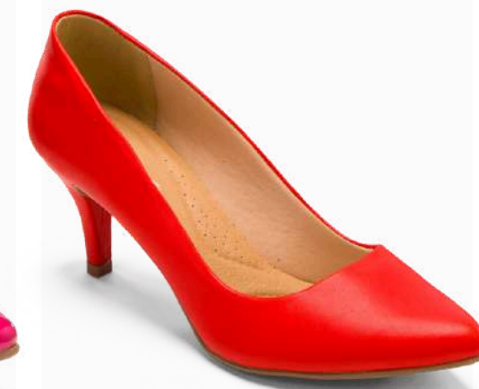
Modelo: SUN-318 Color: ROJO Página: 46