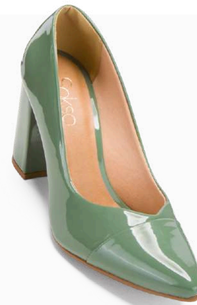
Modelo: SUN-319 Color: VERDE Página: 38