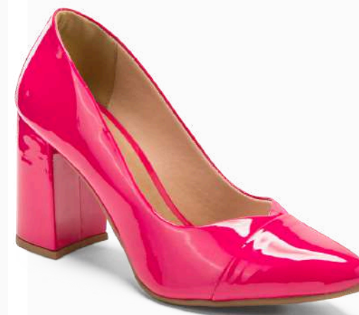
Modelo: SUN-319 Color: MAGENTA Página: 39