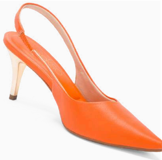
Modelo: BCE-187 Color: NARANJA Página: 44