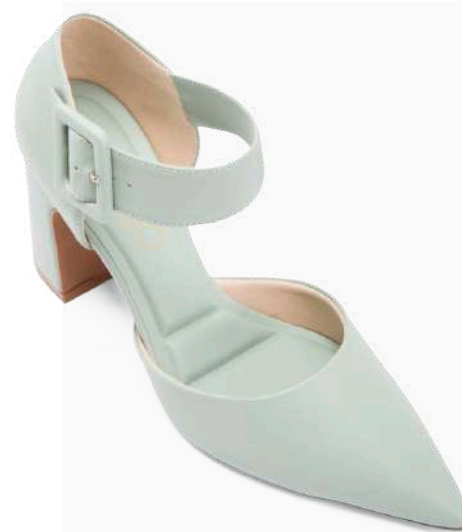
Modelo: BCE-185 Color: CELESTE Página: 43